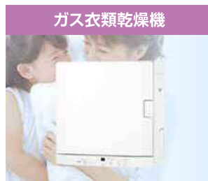
雨や灰も気にせず、家事の時短を実現できます。