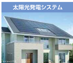
エネファームとの組合せで環境性・経済性がさらに向上。