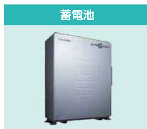
電気をムダなく貯めて必要なときに使う賢いシステム。