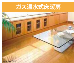
足元から暖かく、身体に優しい理想の暖房。