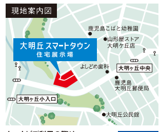
カーナビご利用の際は「鹿児島市大明丘3丁目1番地」を目的地に設定してください。