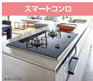
利便性とデザイン性を追求した、コンロの常識を変える次世代コンロ。