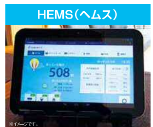
エネルギーの使い方を「見える化」して省エネ行動を促すシステム。