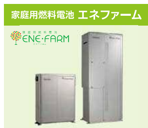
水素と酸素から電気と熱を作り出すマイホーム発電。

最先端のスマート設備で“これからの住まいのあり方”をご体感できる最後のチャンスです!